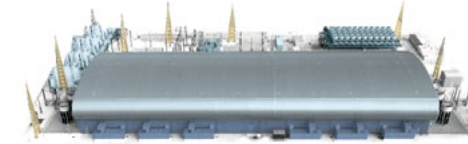
Exemple d'une station de conversion.

Le raccordement en courant alternatif au réseau de transport d'électricité en France et en Irlande, pour permettre un acheminement de l'électricité vers les consommateurs, nécessite dans chaque pays la construction d'une station de conversion. Chaque installation requiert une superficie de 4 hectares environ, comprenant notamment un bâtiment qui mesurera 20-25 mètres de haut étendu sur environ 0,5 ha. La concertation réalisée avec le public et les nombreuses études environnementales ont permis de déterminer en France un tracé privilégié pour la liaison et un emplacement de moindre impact pour la station de conversion.