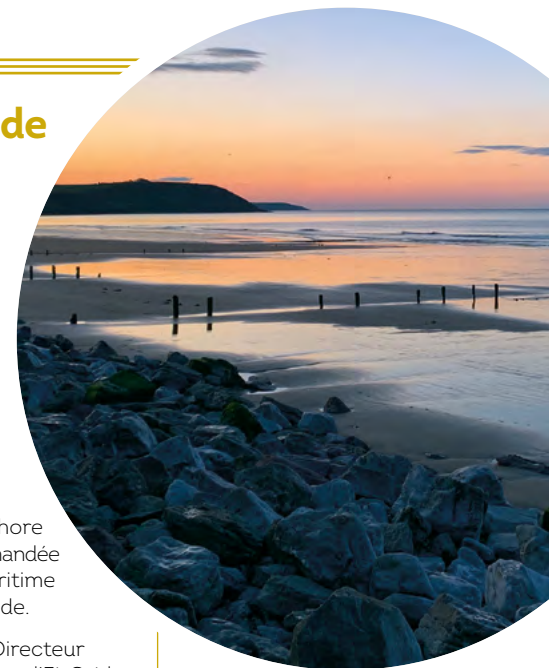
Vue côtière d'East Cork en Irlande.

de l'Union européenne. Il renforcera également le réseau électrique irlandais. Enfin, il contribuera à un avenir énergétique plus propre, en aidant l'Irlande à atteindre l'objectif de 70 % d'électricité produite à partir d'énergies renouvelables en 2030. »